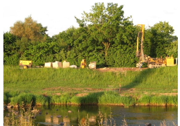
Elzdeich in Teningen