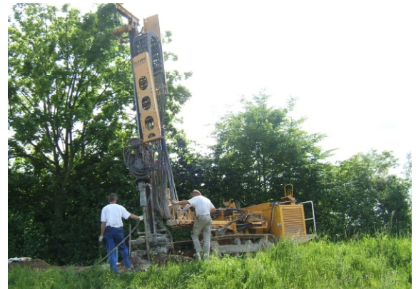
Abteufen der Bohrungen

Mittels Injektion von MTG wurde der Lückenschluss der Spundwand am Düker hergestellt.